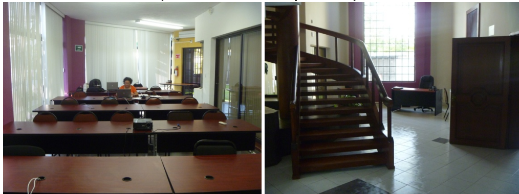
Equipada con proyector, pantalla para proyectar, aire acondicionado y mobiliario adecuado para recibir capacitación y atender reuniones de trabajo con capacidad hasta de veinticinco personas.

Para salvaguardar el archivo documental de auditoría y papeles de trabajo de ejercicios anteriores, se habilitaron dos espacios específicos para el resguardo de dicha documentación.