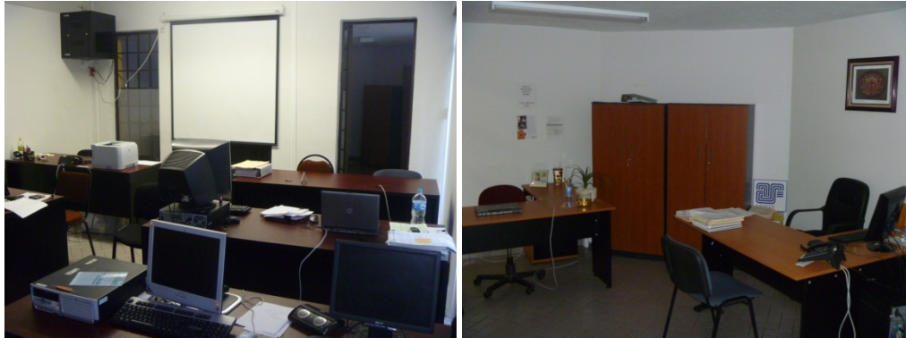
Equipada con mobiliario, sillas ejecutivas, archiveros, aire acondicionado, equipo de cómputo, impresoras, pantalla para proyector, telefonía y red al sistema informático.