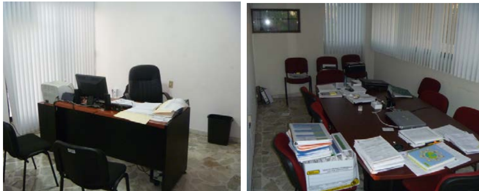
(Oficinas personales, mesas de trabajo y áreas de auditores)